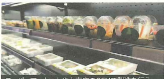
スーパーマーケットや小売店のOEMで製造を行う