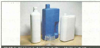
複雑な形状にも対応する高い技術力を持つ