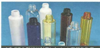
さまざまな形状に対応したペット容器を生産