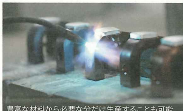
豊富な材料から必要な分だけ生産することも可能