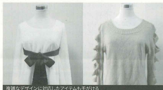
複雑なデザインに対応したアイテムも手がける

●女性用カジュアルウェアを中心にOEM製造を行っている。長年、海外アパレルメーカーから良質な女性衣料品の直輸入・販売を手がけた実績により、現在は、トップス、ボトムス、ジャケットのほか、男性用カバンやキッズ衣料など、幅広いアイテムを取り扱っているのが特徴のひとつ。