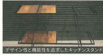
デザイン性と機能性を追求したキッチンスタンド