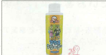
歯磨きができない犬のための「飲むマウスケア」商品

●ペット産業の黎明期より、犬に特化した用品の製造・輸入・販売を手掛ける。「まだ世の中にない課題に挑むこと」を戦略に掲げ、飼い主の声をもとしたマウスケアやスキングア、ヘルスケア、ネイルケアなど、約500種を越えるバラエティー豊かな商品を取り扱っている。