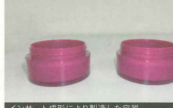
インサート成形により製造した容器

●創業当時より、樹脂を金型に入れて成形する「射出成形」により、健康食品や医療品、食品などの規格品用キャップ・中栓などを製造する。10年ほど前からは、PPおよびPET樹脂において内側と外側で色を変えることが可能。また、重厚感のある肉厚成形ができるインサート成形などにより化粧品容器の製造を中心としている。