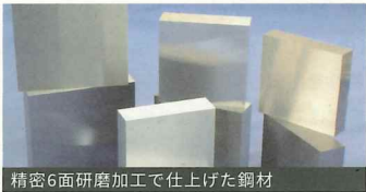
精密6面研磨加工で仕上げた鋼材