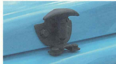
ヒットした「ダイスノック」。個性的な形状も製造可能