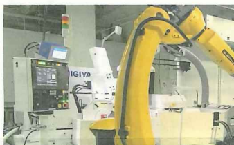
多関節ロボットは複雑な動きも可能