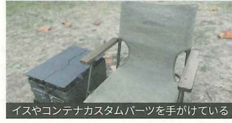
イスやコンテナカスタムパーツを手がけている

●郵便ポストをはじめ、照明や宅配ボックスなどをまとめて設置できる機能門柱を中心としたエクステリア関連の製造・販売を行う。金属素材の特性を熟知し、多彩な加工技術を活かしながら、現在では汎用品だけではなく特注品も扱っている。