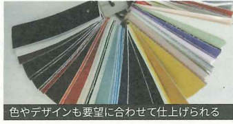
色やデザインも要望に合わせて仕上げられる

●1972年の創業から、カバンやバッグ、靴などの皮革製品に欠かすことができないエナメル加工を行う皮革塗装業を営む。関西では唯一の皮革塗装専門の企業として、1枚2.5㎡から3.4㎡の皮を月間で約150枚も出荷するなど、その技術力が高く評価されている。