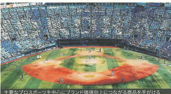
主要なプロスポーツを中心にブランド価値向上につながる商品を手がける

●プロスポーツリーグのレプリカユニフォームや、大手企業のアパレル関連商品を製造するOEM・ODMメーカー。企画提案から効率化を図る製造工程の検討や納品まで一貫体制で、企業のブランド価値を高めるアパレルを中心としたツール製作を行っている。