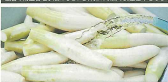
野菜の洗浄工程に時間をかけ、異物混入を防ぐ

●主に漬物、惣菜のOEM製造と、漬物の卸業を手がける食品メーカー。市場のニーズに合わせて、幅広い野菜の加工に対応している。現在は約20種の商品を取り揃え、月に約35万パックを生産する体制を築いた。