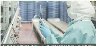
独自の衛生管理手法にもとづき、約140項目の安全基準を守る