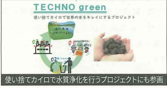
使い捨てカイロで水質浄化を行うプロジェクトにも参画

●金型を製作するための鋼材加工や、メーカーと共同開発したオリジナルブランド鋼材「TECプレート」の製造・販売を行う。1000分の1ミリ単位の精度で加工する技術力に加え、徹底した品質および工程管理、納品までに対応する生産体制を整えている。