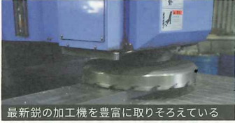
最新鋭の加工機を豊富に取りそろえている