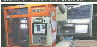
設備も充実し30台をこえる成形機が並ぶ

●創業から半世紀以上、化粧品業界を中心に、食品、雑貨、工業用品に関わるプラスチックボトルを製作している。成形方法は、小ロット多品種生産に適した「ダイレクトブロー成形」と、量産に適した「インジェクションブロー成形」の2部門を有し、幅広い生産能力を備えている。さらに、顧客の多様なニーズに応えるため、多種多様な樹脂原料を扱い、現在では数百種の容器を月産で約300万本も製造できる体制を築いた。