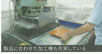
製品に合わせた加工機も充実している

●1960年の創業から一貫し、カードケース、ポーチ、クリアバックなどのビニール製品の製造・販売を手がける。常に変化する市場のニーズを捉えるため、充実した設備を揃え、近年では抗菌性や環境性能を高めた素材を使用するなど、実用性と経済性を兼ね備えた製品を生み出している。