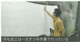
今も加工は一点ずつ手作業で行っている