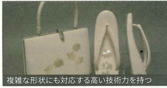
複雑な形状にも対応する高い技術力を持つ