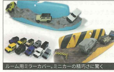
ルーム用ミラーカバー。ミニカーの精巧さに驚く

●ウレタンや繊維強化プラスチックなどを素材とした、車体のバンパーやフロント、ナビを設置する枠組みなどの開発・製造・販売を手がける。企業のOEM製造や一般顧客に向けたオリジナル製品など、一点モノから量産品まで幅広い対応力が支持されている。