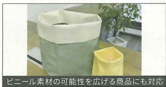
ビニール素材の可能性を広げる商品にも対応