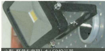
小型・軽量を実現したLED投光器