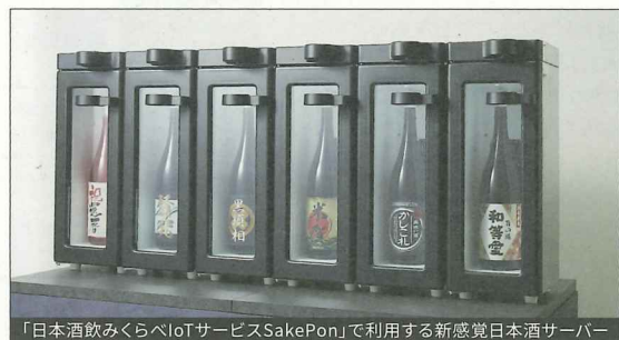
「日本酒飲みくらべIoTサービスSakePon」で利用する新感覚日本酒サーバー

●産業用機器や自動車分野を中心に、「IoT」技術を活用した位置情報、電子ペーパー、電波によるタグデータの読み書きシステムなどの開発・設計・販売を行う。