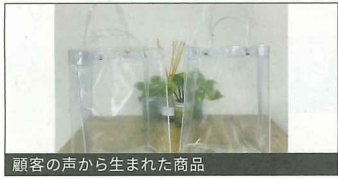
顧客の声から生まれた商品