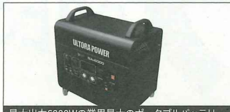
最大出力6000Wの業界最大のポータブルバッテリー