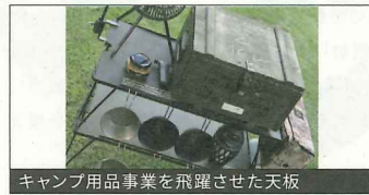
キャンプ用品事業を飛躍させた天板