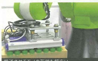
搬送させるモノの形状も幅広い

●製造現場で発生する「取り出す」「運ぶ」「入れる」「検査する」という作業を効率化するロボットの設計・開発・製造を行う。現場内にある複数のロボットを効率よく稼働させるシステムの構築・設計をはじめ、NS施盤に対応した自社開発の「標準ガントリー」や「ロボローダー」など、製品の種類は多岐にわたる。