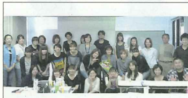
マウスケアメンターの無料セミナー。1万人の育成をめざす