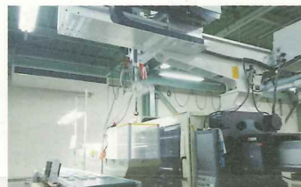
100トンから220トンまでの充実した成形機を整備