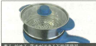
煮る、炒める、蒸すができる万能調理器

●店舗や商業施設などで利用されるLED投光器を中心とするLED関連製品のほか、リチウムバッテリー、エアコン、害獣撃退装置、植物育成機など、豊富な製品の開発・製造・販売を手がけている。