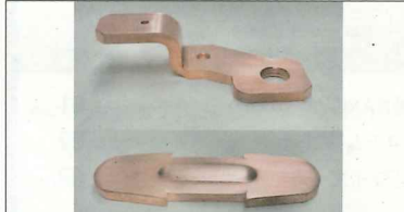
柔らかく傷つきやすい銅を熟練の職人が加工していく

●創業から半世紀以上にわたり、自動車や電源スイッチ、電信柱などに関連する通電部品の加工を行う。業界有数の銅加工をはじめ、銅と他金属と接合させる「ロウ付け」の両方に対応できることが強みで、関西を中心に全国各地のメーカーとも取引実績を持つ。